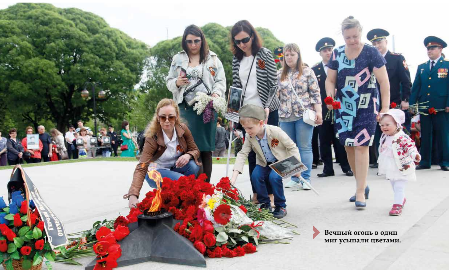
► Вечный огонь в один миг усыпали цветами.

тизаны, бойцы сопротивления, труженики тыла, узники концлагерей, блокадники, дети войны. А следом чеканили шаг музыканты военного оркестра, курсанты, офицеры Серпуховского филиала военной академии РВСН имени Петра Великого и все остальные участники акции: сотрудники администрации, депутаты, работники городских предприятий и учреждений, члены общественных и молодежных организаций, спортсмены и инициативные жители города всех возрастов. Тысячи горожан несли в руках портреты родных и близких, своих героев, сражавшихся на фронтах Великой Отечественной войны.