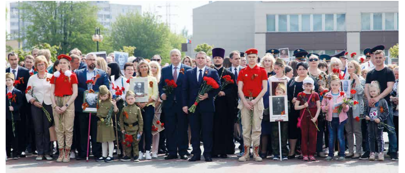
► Минута молчания на площади Славы: никто не забыт, ничто не забыто.

С каждым годом эта поистине народная акция