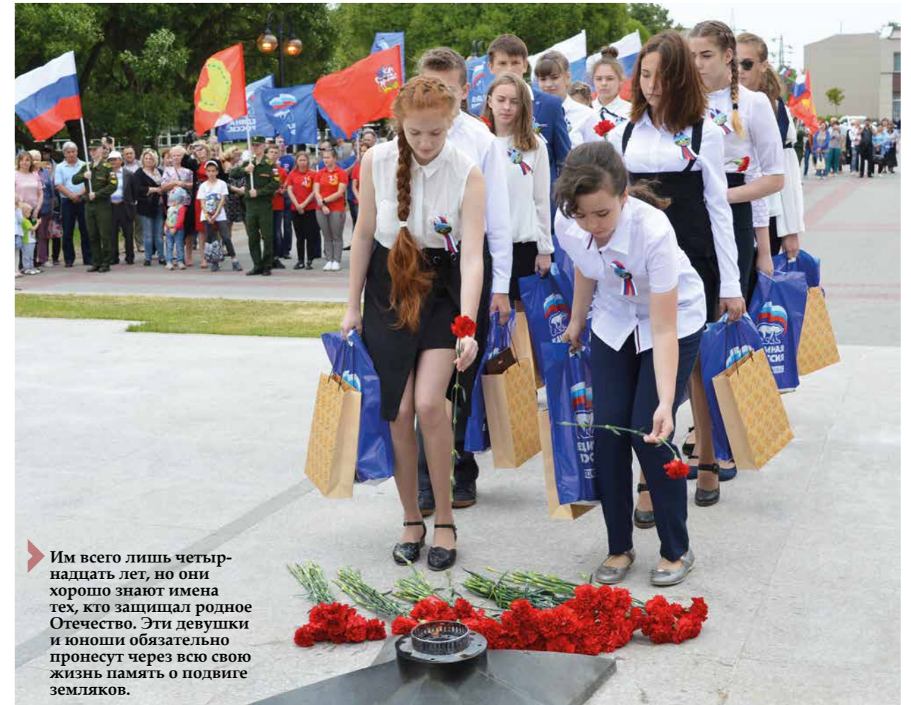
▶ Им всего лишь четырнадцать лет, но они хорошо знают имена тех, кто защищал родное Отечество. Эти девушки и юноши обязательно пронесут через всю свою жизнь память о подвиге земляков.

День России — молодой праздник. Буквально 5 лет назад мало кто мог ответить на вопрос о том, что мы в этот день отмечаем. Сегодня ситуация изменилась. Уже каждый ребенок знает о Дне России и понимает, что этот день для нас является символом свободы и независимости России, осознает, что сила нашей страны в единстве и патриотизме русского народа. Большой заслугой в этом является формат и масштаб проводимых в этот день мероприятий — в городе ежегодно организуется большое количество торжественных мероприятий и концертных программ для жителей города. Серпуховичи с удовольствием принимают в них участие. Важный праздник! Я бы даже сказала — стратегический! Поэтому я желаю величия и мощи нашей Родине, а каждому человеку — чувствовать себя свободным, нужным и счастливым!