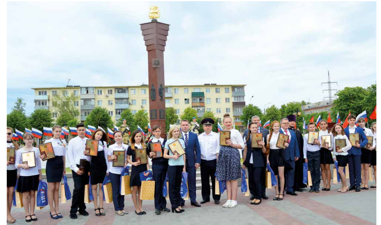
Общее фото на долгую память: этот День России для юношей и девушек особенный.