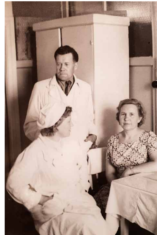
Годы работы в больнице им. Семашко города Серпухова.

Дорогой, слышь, слышь, слышь, но старая история, про которую я тебе уже писал в прошлом году в письме. Слышь, слышь, слышь, и всегда ты будешь помнить, что ты солдат, а не просто человек. Вот и все, что можно сказать тебе сейчас. Вспомни, что ты солдат, а не просто человек. И помни, что ты солдат, а не просто человек.