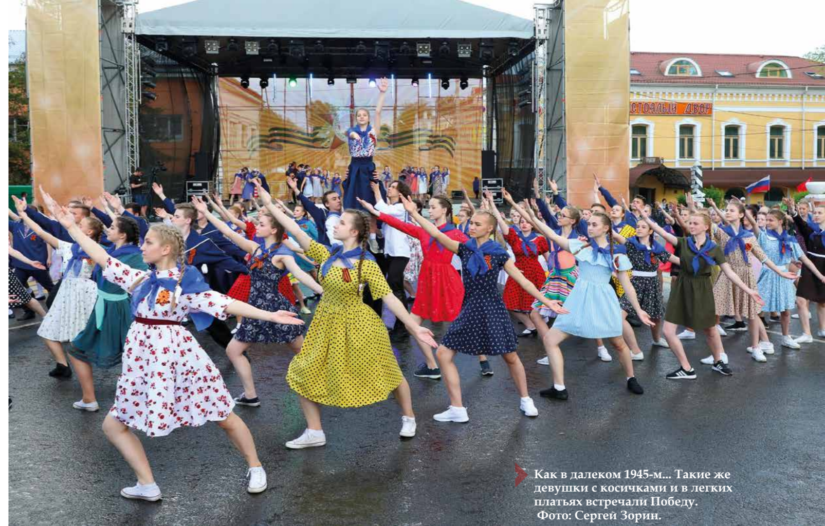
➤ Как в далеком 1945-м... Такие же девчонки с косичками и в легких платьях встречали Победу.

наибольший восторг у мальчишек, многие из которых даже осмеливались задавать военнослужащим вопросы и, что очень важно, получили на них исчерпывающие ответы.