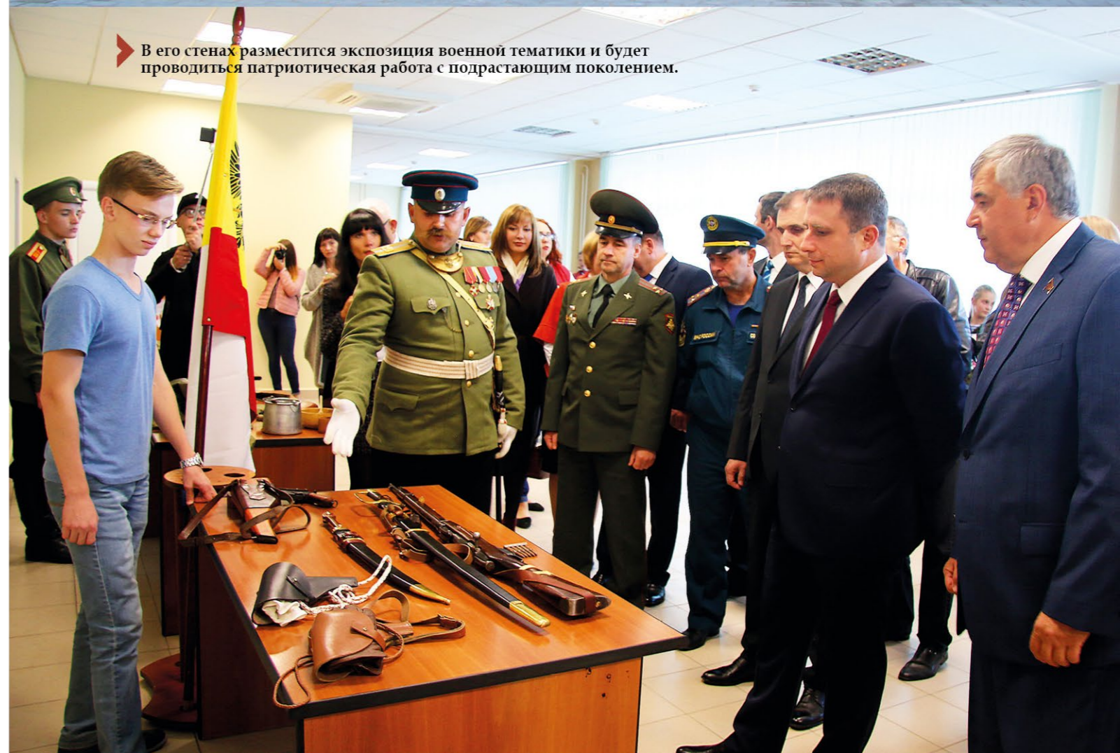
➤ В его стенах разместится экспозиция военной тематики и будет проводиться патриотическая работа с подрастающим поколением.