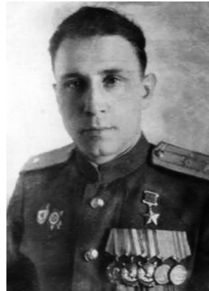
➤ Герой Советского Союза И. П. Курятник.