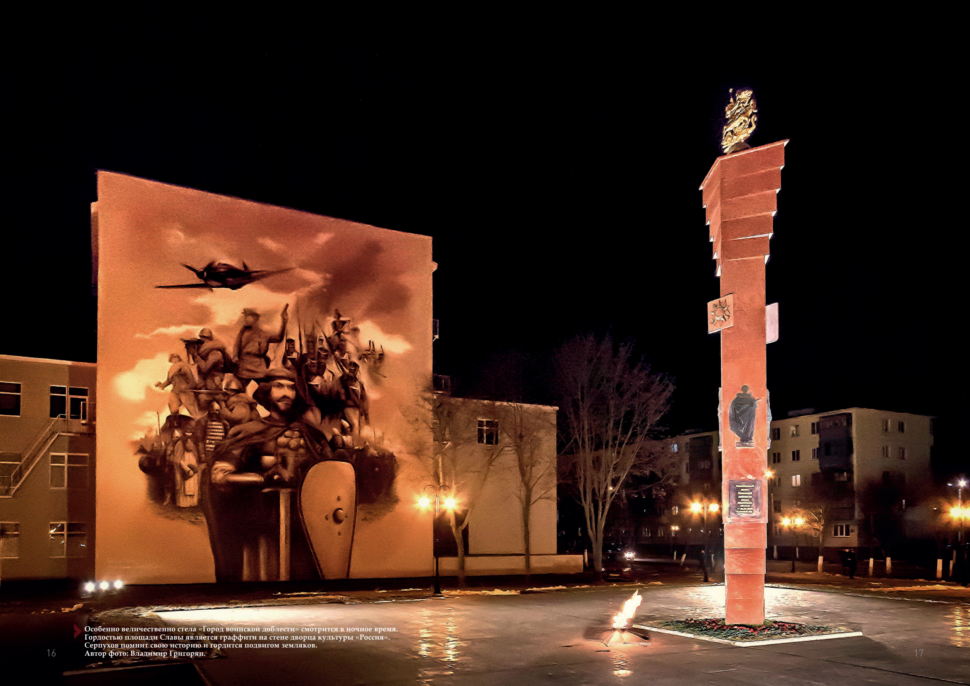
Особенно величественно стела «Город воинской доблести» смотрится в ночное время. Гордостью площади Славы является граффити на стене дворца культуры «Россия». Серпухов помнит свою историю и гордится подвигом земляков.