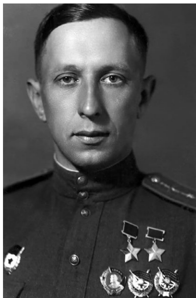
➤ Дважды Герой Советского Союза В. Н. Осипов.