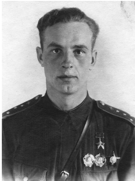
➤ Герой Советского Союза Г. А. Григорьев.