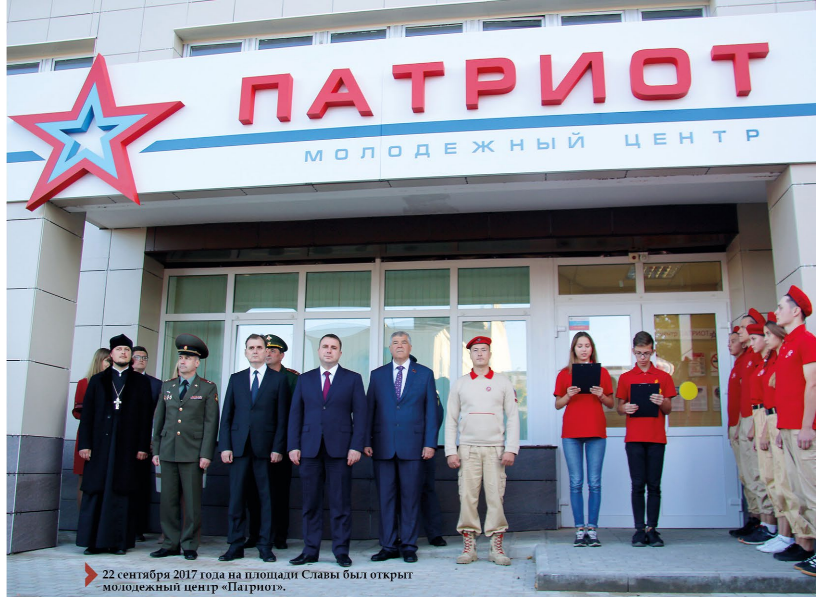
➤ 22 сентября 2017 года на площади Славы был открыт молодежный центр «Патриот».

«Для меня 5 декабря — священный день. Дорогие ветераны, наши деды и бабушки смогли отвоевать советские земли и не дали фашистам захватить нас, сломать наше будущее».