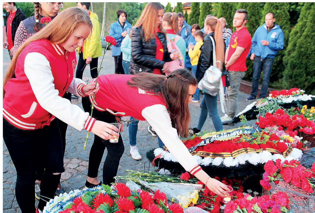
Молодогвардейцы — постоянные участники митингов и вахт Памяти на Соборной горе.