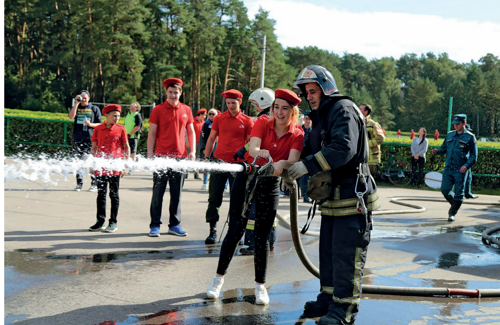
На стадионе «Спартак» 15 сентября состоялось торжественное открытие первого патриотического форума «Серпуховский рубеж», в котором приняли участие отряды Юнармии.