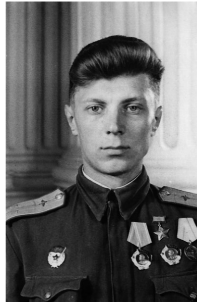
➤ Герой Советского Союза В. Ф. Рошенко.