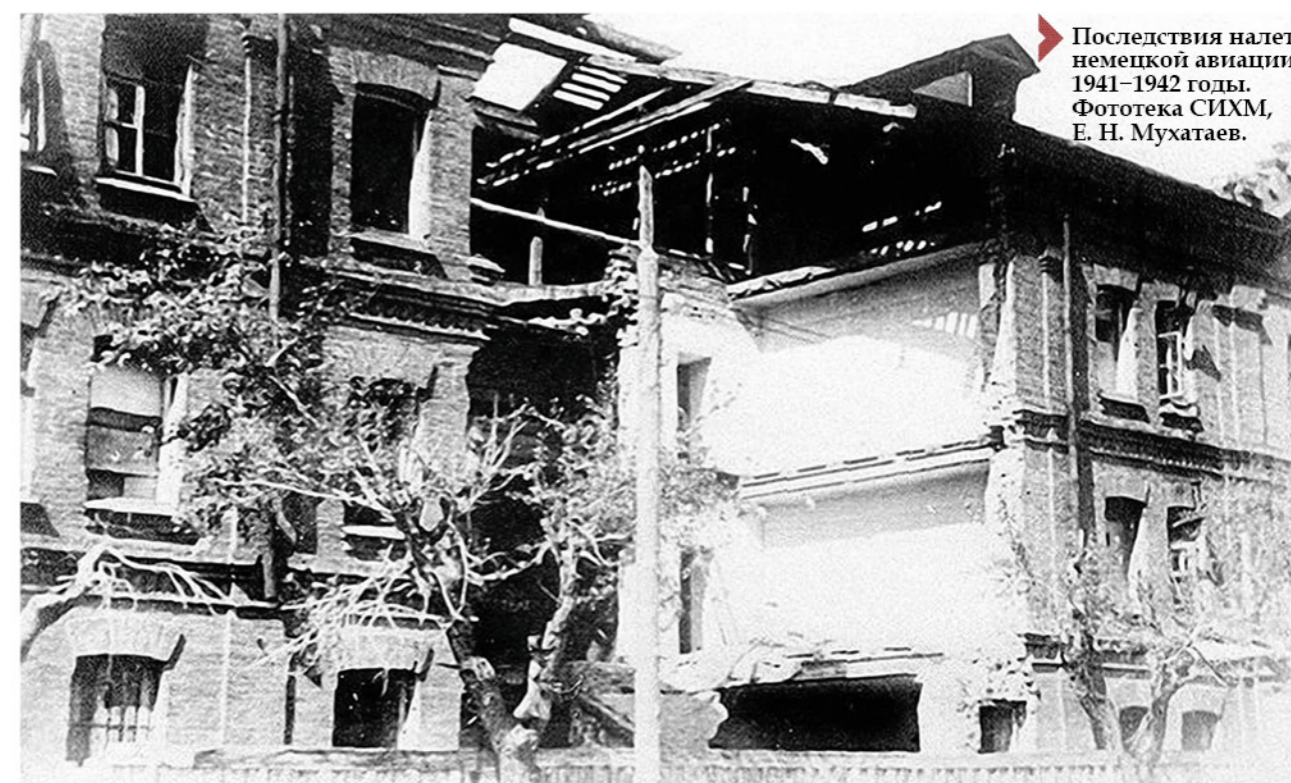
➤ Последствия налета немецкой авиации. 1941–1942 годы.