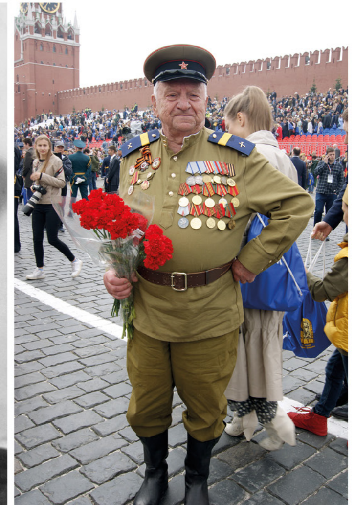
Москва, май 2019 года.