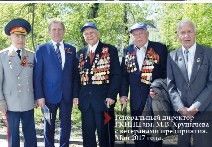
Генеральный директор ГКНПЦ им. М.В. Хруничева с ветеранами предприятия. Май 2017 года.