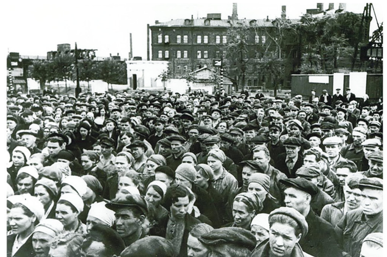
Рабочие завода «Серп и Молот» слушают заявление советского правительства о вероломном нападении фашистской Германии на СССР. 22 июня 1941 года.

3 час. 15 мин. Румынская авиация наносит удары по территории Молдавской ССР,