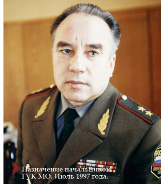
Назначение начальника ГУК МО. Июль 1997 года.