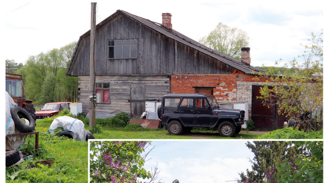
На этом месте, где сегодня находится частное домовладение, в годы войны располагался полевой госпиталь.

Да и находиться в селе было небезопасно, так как здесь, в Шатово, разместились штаб 60-й стрелковой дивизии, отделение связистов и медсанбат, ввиду чего этот населенный пункт подвергался постоянным артобстрелам и бомбовым ударам неприятеля. К октябрю 1941-го немецкие войска вплотную подошли к Московской области, заняв Калугу, и наш город, по сути, был единственной преградой на подступах к столице. Поэтому Сталин приказывает: «Серпухов врагу не сдавать». И вот все силы переброшены на удержание фронта в районе деревень Малеево и Екатериновка Калужской области, находящихся на границе с Серпуховским районом. Через село Шатово каждый день проходило новое пополнение. Бойцы 60-й стрелковой дивизии шли и шли. Подойдя к Екатериновке, они целовали знамя и шли в бой.