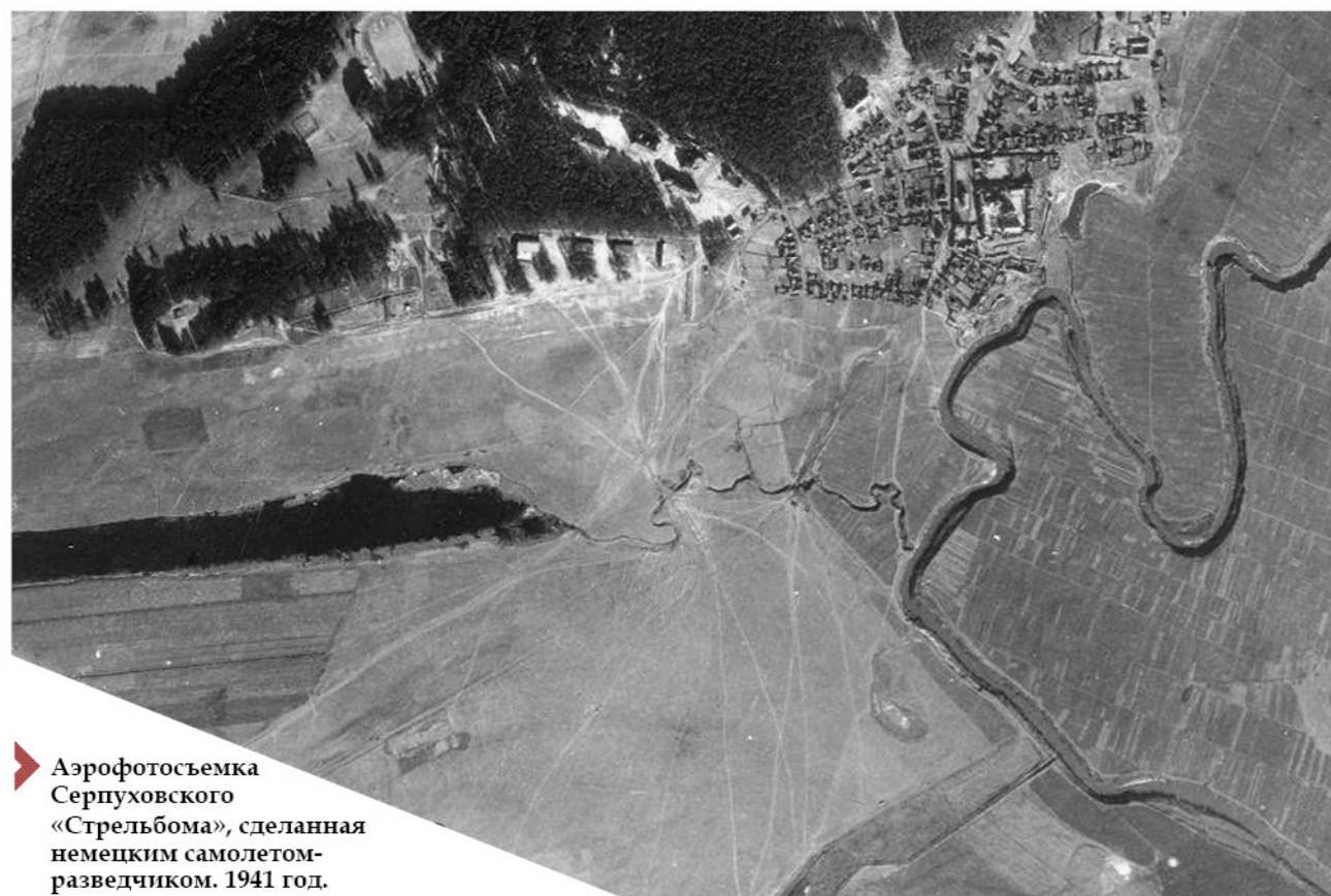
➤ Аэрофотосъемка Серпуховского «Стрельбома», сделанная немецким самолетом-разведчиком. 1941 год.