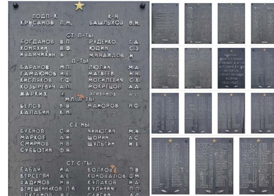
Братская могила советских воинов и памятный знак воинам-односельчанам. Поселок Слатино, Дергачевский район, Харьковская область, Украина.

письмо. Похоронка...». А она в этом ярком, теперь уже ставшем нелепым, сарафане. И зачем только она его надела? В глазах потемнело, и она осела в дверях, так и не спустившись с крыльца.