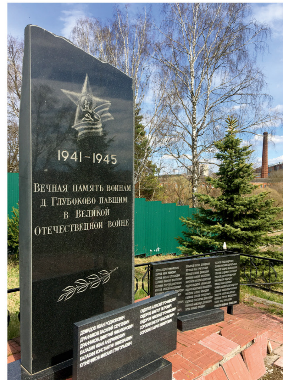
➤ Обелиск в память о погибших односельчанах. Деревня Глубоково, г.о. Серпухов.