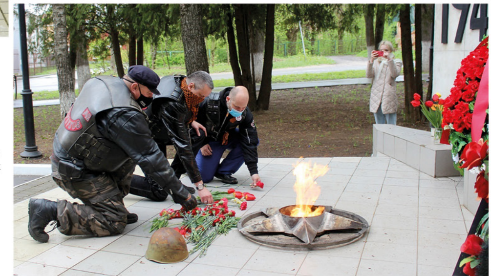
▶ Члены мотоклуба «Ночные волки», используя все меры защиты, приняли участие в церемонии возложения цветов к мемориалам Великой Отечественной войны.