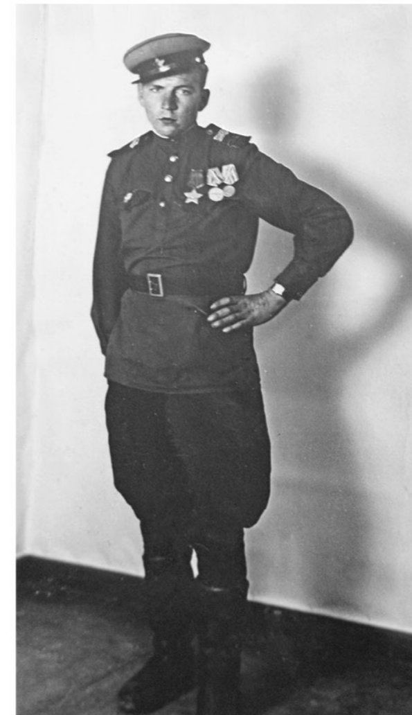
Берлин, май 1945 года.

Краткое изложение личного боевого подвига или заслуги: 29-30 апреля 1945 года в бою, в районе Сарландштрассе, находясь в боевых порядках пехоты, под снайперским и пулеметным огнем противника обнаружил и засек: Зенитную батарею, 4 фаустника, 4 крупнокалиберных пулемета, 9 снайперов и 8 пулеметов. Все обнаруженные цели были уничтожены огнем батареи.