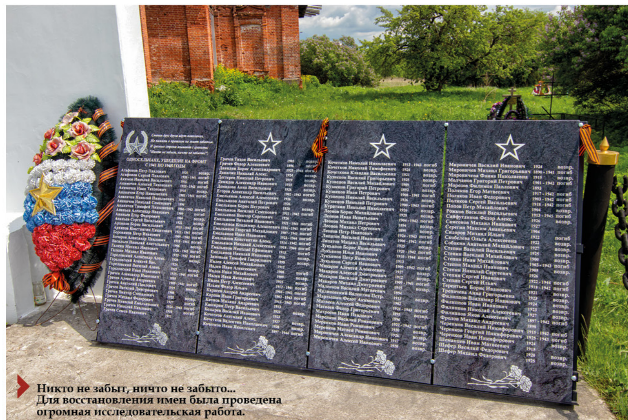
Никто не забыт, ничто не забыто... Для восстановления имен была проведена огромная исследовательская работа.