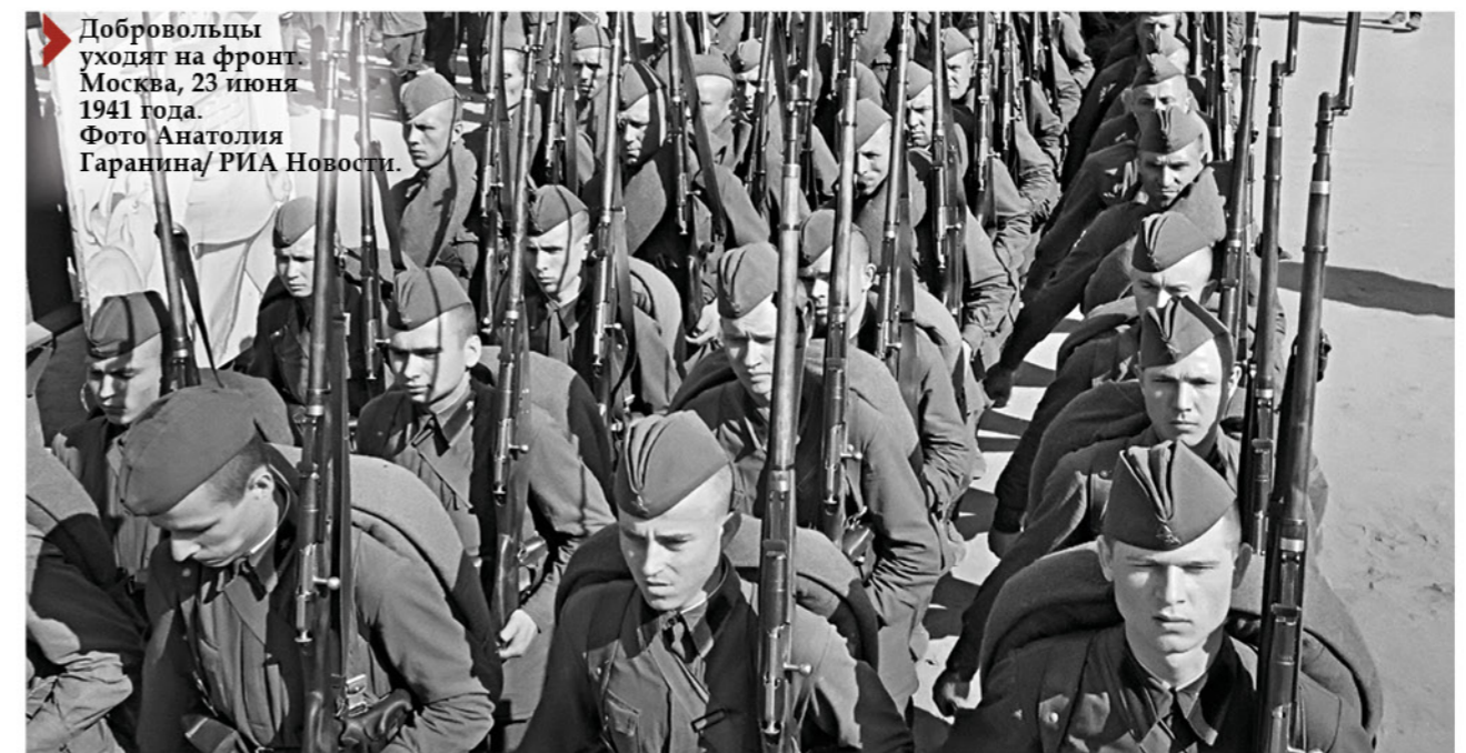
Добровольцы уходят на фронт. Москва, 23 июня 1941 года.

ли все военнообязанные с восемнадцати лет.