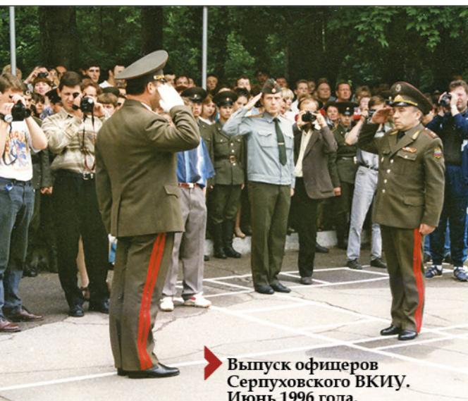
Выпуск офицеров Серпуховского ВКИУ. Июнь 1996 года.