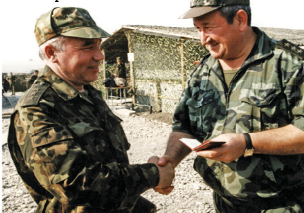
С командующим войсками СКВО генерал-полковником Г. Н. Трошевым.