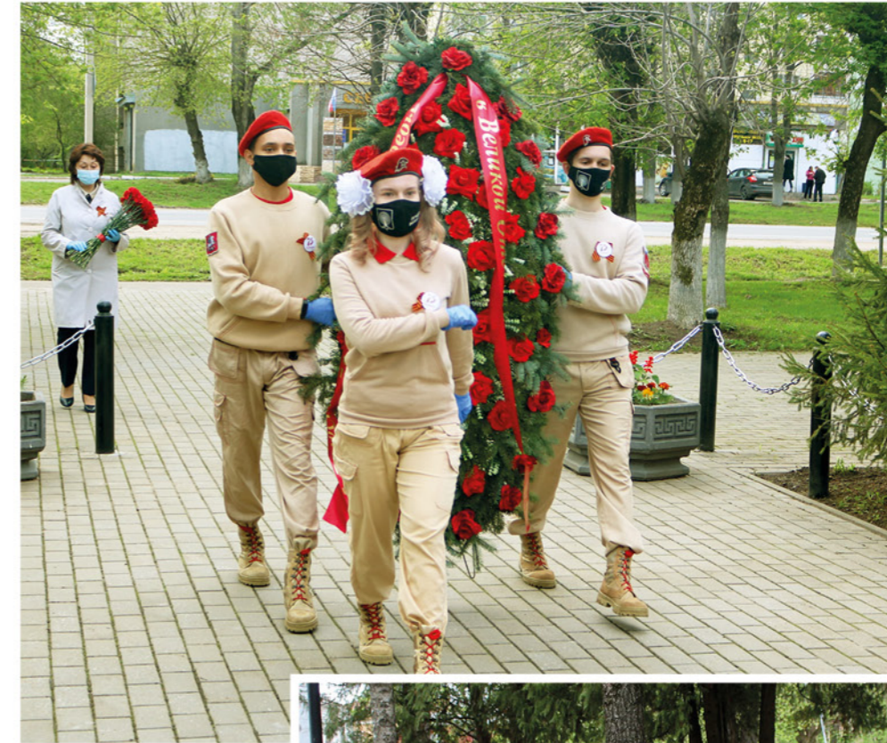
▶ Еще одно из мест возложения венков — мемориал в поселке Большевик.