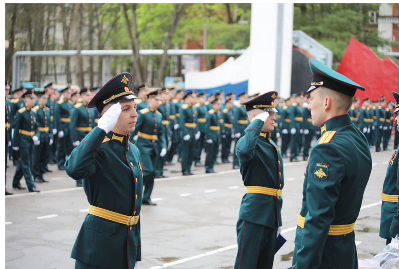
▶ Молодые офицеры получают от старших по званию дипломы и нагрудные знаки.

— Честь и достоинство офицерского звания — это символ благородства и бескорыстного служения родному Отечеству, — обратился к лейтенантам заместитель командующего РВСН ге-