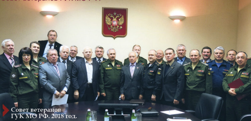
Совет ветеранов ГУК МО РФ. 2018 год.