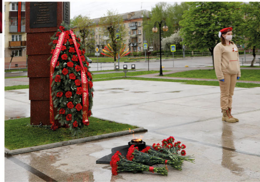
▶ Молодогвардейцы, несмотря на пандемию, несут священную вахту Памяти.