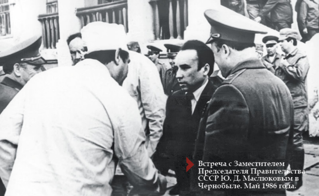
Встреча с Заместителем Председателя Правительства СССР Ю. Д. Маслюковым в Чернобыле. Май 1986 года.