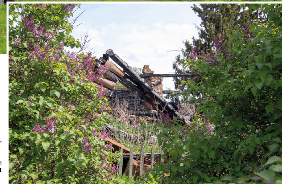
В 2018-м году этот дом был практически полностью утрачен из-за пожара. А именно в нем в октябре-декабре 1941-го года находился штаб 60-й стрелковой дивизии.