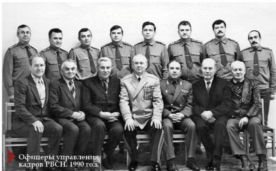
Офицеры управления кадров РВСН. 1990 год.