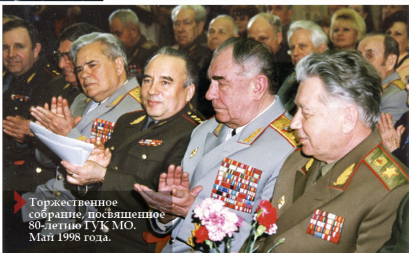
Горжественное собрание, посвященное 80-летию ГУК МО. Май 1998 года.